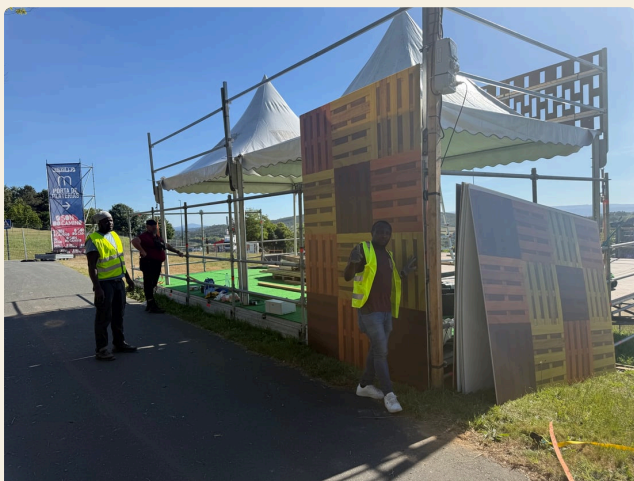
DÍA 1 · ARRANCA A MONTAXE