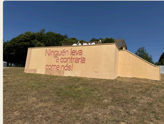
FACHADA · «NINGUÉN LEVA A CONTRARIA COMA NÓS!»

Fachada, cubo de palés, terraza con moqueta, plantas e o rótulo de neón — listos para o público o 17 de xuño.