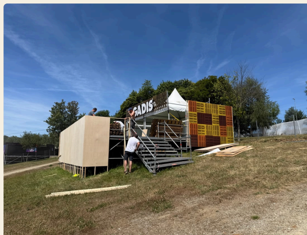
DÍA 2 · A ESTRUCTURA EN PÉ