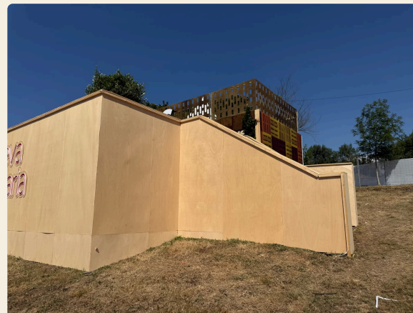
LATERAL COAS PLANTAS DE COROAMENTO