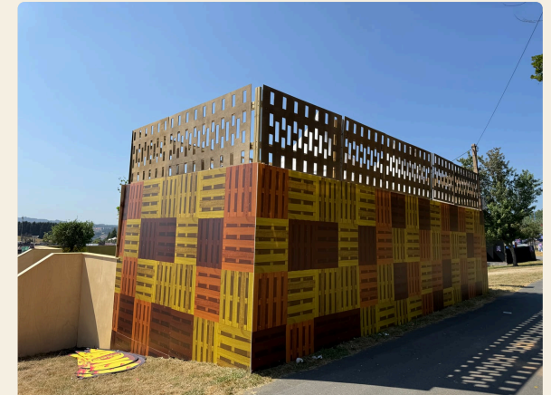
CUBO DE PALÉS CON CELOSÍA