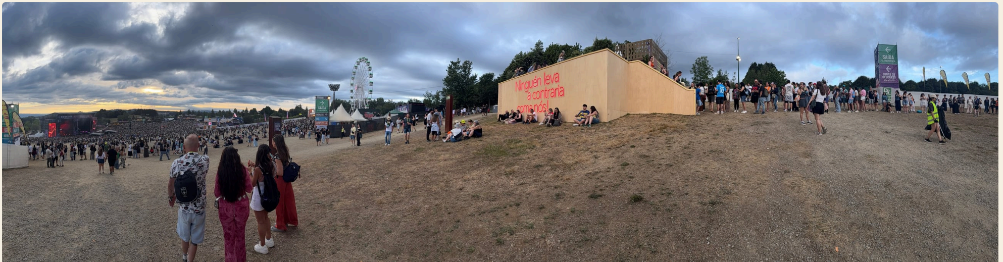
PANORÁMICA DO RECINTO CO STAND E O PÚBLICO AO SOLPOR