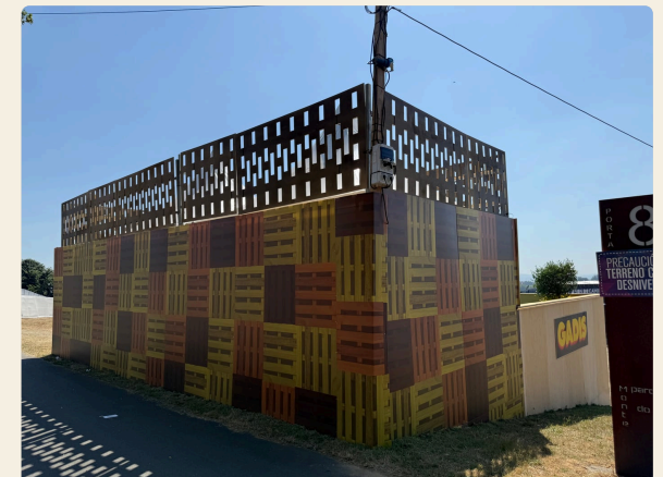
ESQUINA XUNTO Á PORTA 8