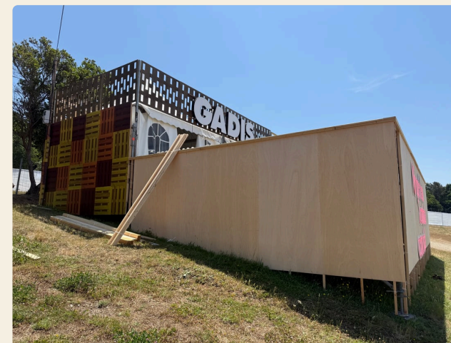
DÍA 3+ · ACABADOS