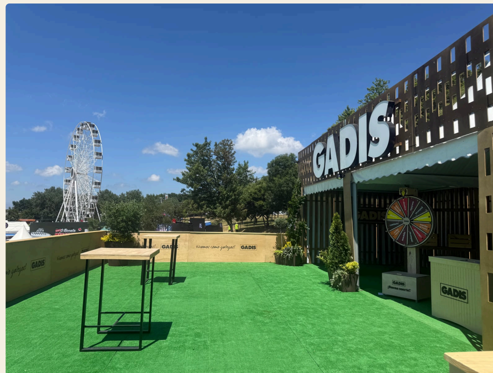
A TERRAZA REMATADA – MOQUETA, MESAS E AS LETRAS CORPÓREAS GADIS